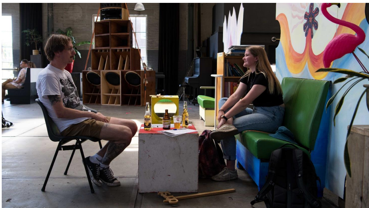
Proefdraaien met de vrijwilligers binnen de coronamaatregelen

Deze groep vrijwilligers zorgt voor allerlei taken. Techniek, skateles, schoonmaak, assistent van beheer en onderhoud, maar ook receptie, communicatie en kantoorwerk. Daarnaast zijn zij natuurlijk actief in het programma wat we op cultuur- en skatevlak bieden. We vinden voor iedereen een plek. Door de aanstaande verbouwing hebben zij ook veel kunnen betekenen in het opruimen van het pand. In de afgelopen 9 jaar was er flink wat materiaal verzameld wat nu een nieuwe bestemming of afvalcontainer mocht vinden.