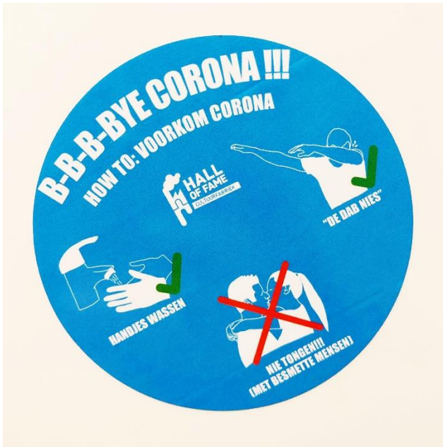
Sticker ontworpen door stagiaire Rosan in maart 2020